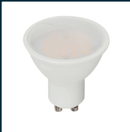
Żarówka LED V-TAC 2,9W GU10 VT-2333 4000K 250lm SKU 2988 EAN 3800157690362 VT-2333

Produkty powiązane (SKU): 2987, 2989, 212988